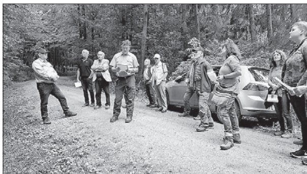
Dabei wurde über den Zustand des Waldes berichtet.